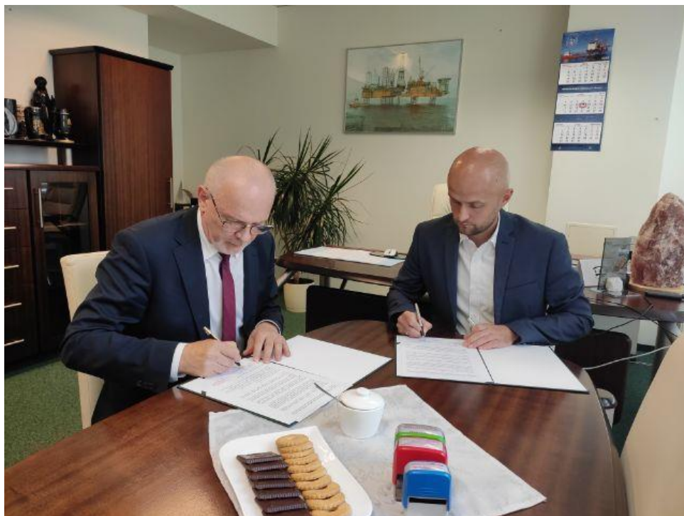
Podpisanie porozumienia z Dyrektorem Urzędu Górniczego w Gdańsku.

- w listopadzie 2023 r. porozumienie z Komendantem Centralnego Biura Śledczego Policji, na podstawie którego powołany został wspólny Zespół Koordynacyjny Zarządu w Bydgoszczy Centralnego Biura Śledczego Policji oraz Kujawsko-Pomorskiego Wojewódzkiego Inspektoratu Ochrony Środowiska. Współpraca odbywa się na bieżąco i obejmuje śledztwo dot. nielegalnego obrotu odpadami. Oficjalne spotkanie odbyło się w lutym 2024 roku.