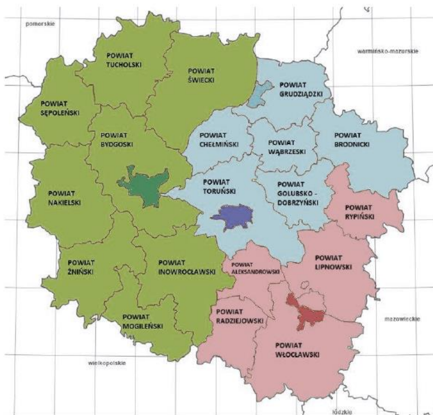
Rysunek 1. Właściwość terytorialna WIOŚ w Bydgoszczy i poszczególnych Delegatur